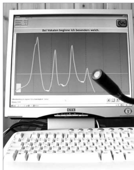
Abb. 1: Mit Hilfe des Computerprogramms „flunatic!“ wird systematisch eine neue weiche, gebundene Sprechweise eingeübt.

Nach einem Angehörigentag im Institut verbringen die Klienten zwei Tage zu Hause, um das alltägliche Umfeld auf das „neue Sprechen“ vorzubereiten. Beim „In vivo-Training“ in der dritten Woche werden unterschiedlichste Sprechsituationen bewältigt, wie z. B. Reden vor Schulklassen, Einkaufsgespräche oder das Ansprechen von Passanten. Neben dem Intensivkurs gehören zwei dreitägige Auffrischungs-