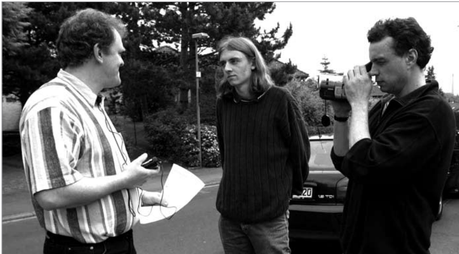
Abb. 2: In der Evaluation der KST werden Sprechsituationen mit Fremden, u.a. Interview von Passanten, mit in die Sprechflüssigkeitsmessungen aufgenommen.

Die Sprechflüssigkeit wird dementsprechend in vier verschiedenen und alltagsnahen Sprechsituationen erfasst: (1) Freies Sprechen im Interview mit dem Therapeuten (300 bis 500 Silben), (2) Lesen eines Artikels von ca. 300 Silben, (3) Telefongespräch mit einer fremden Person über mindestens 3 min., (4) Passantenbefragung von mindestens 3 min. Dauer. Die Sprechbeispiele werden mit einem Diktaphon und einer Videokamera aufgenommen (Abb. 2). Die Sprechflüssigkeit wird nach der in der Literatur gängigsten Messweise in Prozent der unflüssig gesprochenen Silben nach den Richtlinien von Boberg und Kully zu fünf unterschiedlichen Zeitpunkten beurteilt ( Jehle , 1994): (1) vor Therapiebeginn, (2) nach Abschluss des Intensivprogramms, (3) nach einem Jahr, (4) nach drei Jahren und (5) nach fünf Jahren. Die Transkription und Auszählung erfolgt durch eine verfahrensblinde Person.